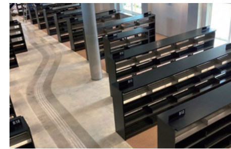
点字舗工事(黒石市立図書館)