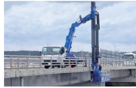
橋梁点検車(自社保有)