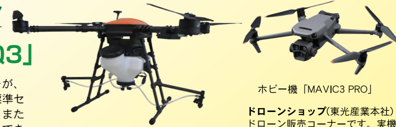
新型農業用ドローン「TSV-AQ3」