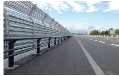
ガードパイプ(大館市 日浴道)