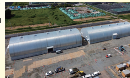
TOKO防災シェルターは、南極昭和基地等への納入実績を持つTOKOドームの技術をフィードバックしています。