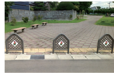
車止・インターロッキング・リサイクルベンチ(大館市比内町 扇田ふれあい公園)