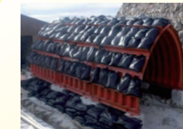
全国で初めて鋼製噴石避難用シェルターを御嶽山へ設置

ドローンショップ(東光産業本社)ドローン販売コーナーです。実機の展示・販売やメンテナンスまでワンストップで承ります。